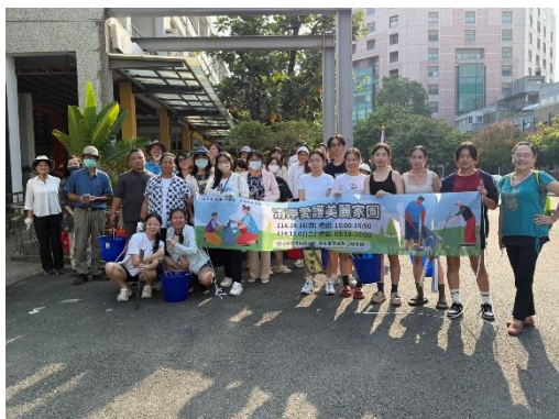
清淨愛護美麗家園