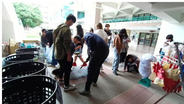
資源回收定向活動