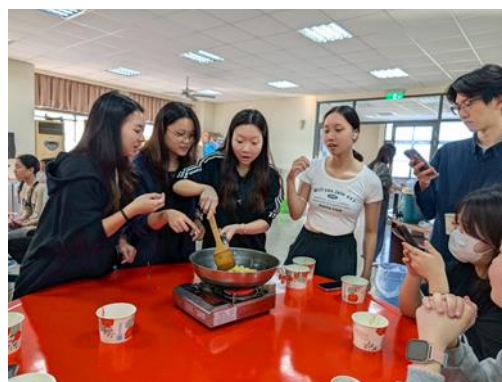
環境教育活動-台南家鄉古早味