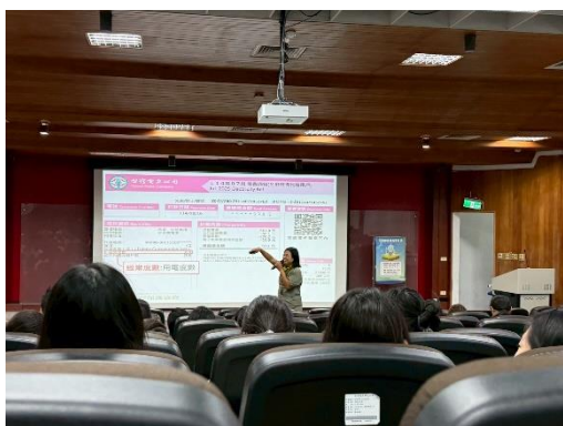
環境教育講座-大家都能成為省電俠