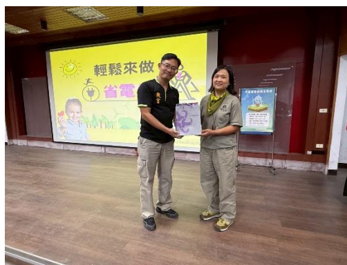
環境教育講座-大家都能成為省電俠