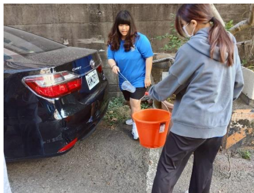
清淨愛護美麗家園