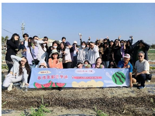
環境教育活動-台南家鄉古早味